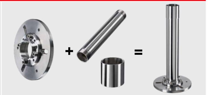
ACHAMA Montageadapter ACHAST300 / ACHAPA Reflexionsschutzrohr / Rohradapter ACCTLRM Ofenanbauarmatur für CSLaser/ CTlaser