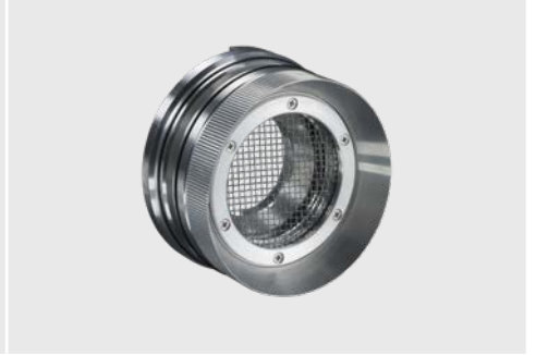
ACCJAFUxx + ACCJAPGMS 2 oder 3 Fokussiereinheit mit Schutzgitter für CoolingJacket Advanced