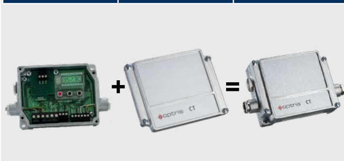
CT Elektronikbox ACCTCOV Gehäusedeckel für CT Elektronikbox Geschlossene CT Elektronikbox