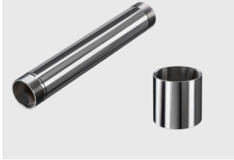
ACHAST300 + ACHAPA Reflexionsschutzrohr M48x1,5, Länge: 300 mm + Rohradapter M48x1,5 Innengewinde für CoolingJacket