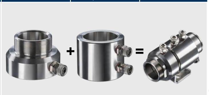
ACCTLAP Freiblasvorsatz ACCTLW Wasserkühlgehäuse Kühlung Sensorkopf + Freiblasen der Optik