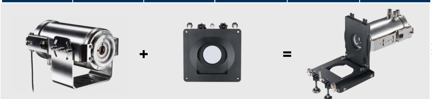
ACCTLCJA CoolingJacket Advanced ACCJAAPLS Freiblasvorsatz laminar für CoolingJacket Advanced CoolingJacket Advanced mit Freiblasvorsatz laminar