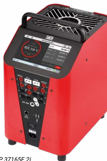
TP 37165E.2i integriertes Messinstrument